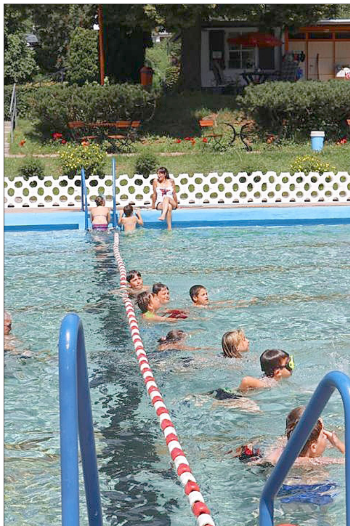
Die Schwimmkurse und das Schulschwimmfest waren in diesem Jahr sehr beliebt.

„Erfreulicherweise gab es in dieser Saison in allen drei Freibädern keine größeren Unfälle oder Verletzungen. Auch der nächtliche Vandalismus hielt sich zum Glück sehr in Grenzen“, resümierte Steffi Häfner.