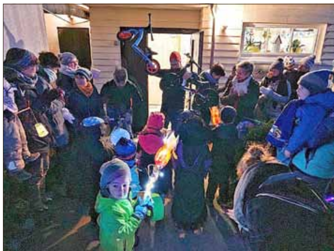
Übergabe der Laufräder durch die Tischtennisfreunde an die „Kuschelstübchen“-Kinder in Rotterode.