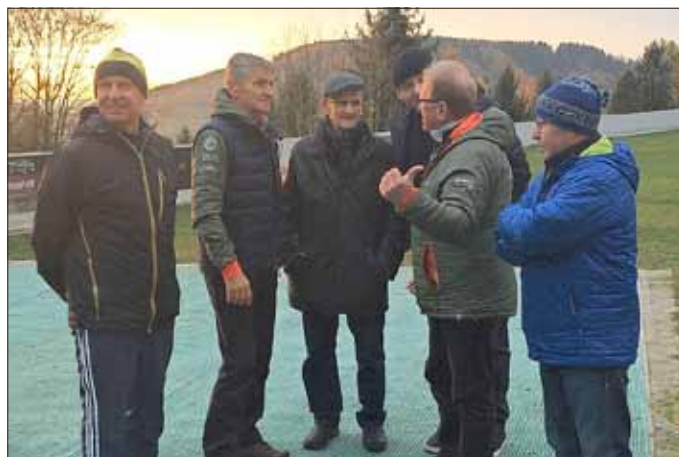
Fachlicher Austausch beim Sprungtraining an den Hallenburg-Schanzen. Helmut Recknagel im Gespräch mit Kati Wilhelm sowie Trainern und Verantwortlichen des Skiclub Steinbach-Hallenberg.