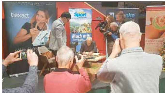
Presserummel wie zu besten Sportlerzeiten: Eintrag ins Goldene Buch der Stadt Steinbach-Hallenberg.

Zum Abschluss trugen sich die beiden ehemaligen Weltklassesportler noch ins Goldene Buch der Stadt Steinbach-Hallenberg ein. Außerdem signierten beide mehrere Skisprung- und Langlaufski mit persönlichen Widmungen, welche zugunsten der Jugendarbeit des Skiclubs versteigert. Dr. Helmut Recknagel nahm sich auch nach der Veranstaltung für jeden Autogrammwunsch und für viele Erinnerungsfotos Zeit. Ein rundum gelungener Abend mit vielen zufriedenen Gästen. Mein persönlicher Dank gilt allen Helfern und den Organisatoren, die zum Erfolg der Veranstaltung beigetragen haben.