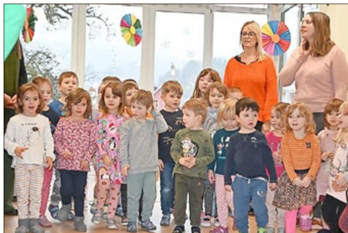
Mit Spannung erwarten die Kinder und Erzieherinnen die offizielle Freigabe des neuen Rollenspielraumes.