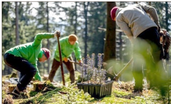
Im letzten Jahr wurden im „Zukunftswald Unterschönau“ durch Freiwillige viele Weißtannen angepflanzt.

Der Bergwaldprojekt e.V. engagiert sich seit über 30 Jahren als internationale Naturschutzorganisation für den Schutz, Erhalt und die Wiederherstellung von Ökosystemen, die Förderung des Bewusstseins für die Verbundenheit mit der Natur und ihre Unersetzlichkeit sowie die aktive Mitgestaltung der sozial-ökologischen Transformation in der Gesellschaft. Zu diesem Zweck arbeitet der Bergwaldprojekt e.V. jährlich mit ca. 5.000 Freiwilligen in Wäldern, Mooren und Offenlandschaften in Deutschland. Im Jahr 2024 werden 186 Projektwochen an 95 verschiedenen Standorten in ganz Deutschland stattfinden.