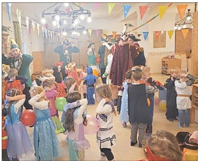
Kinderfasching mit Besuch des Viernauer Dreigestirns in der Kita „Friedrich Fröbel“.

Es habe eine Neuorientierung gegeben, die vor allem den Bedürfnissen der Kinder sehr entgegen kommt aber auch der Traditionspflege des Gagenkarnevals im Kindergarten gerecht wird“, betonte Schindler und lobte die enge und gute Zusammenarbeit mit dem Elferrat. Viele Kinder seien bereits in Tanzgruppen oder auch über die Eltern aktiv beim Gagenkarneval dabei und auch im Kindergarten werde die 5. Jahreszeit natürlich nach wie vor gebührend gefeiert und gelebt.