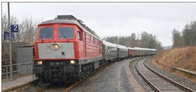
Diesellok „Ludmilla“ machte auf ihrer Fahrt durch Thüringen auch Halt am Bahnhof Steinbach-Hallenberg.

Gespannt wartete er mit Ehefrau Andrea auf eine Gruppe von Besuchern aus Gera, die mit den von „Ludmilla“ gezogenen historischen Wagen nach Steinbach-Hallenberg kamen, um hier einige erlebnisreiche Stunden zu verbringen. Ganz gemütlich begrüßte er sein neues Volk und kündigte einen Fußmarsch zum Metallhandwerksmuseum an. Dort konnte man sich eine Rostbratwurst schmecken lassen. Danach lernten die Besucher das Museum kennen und schauten beim Schmieden zu. Wer wollte, konnte mit dem Burgvogt zur Ruine Hallenberg wandern.