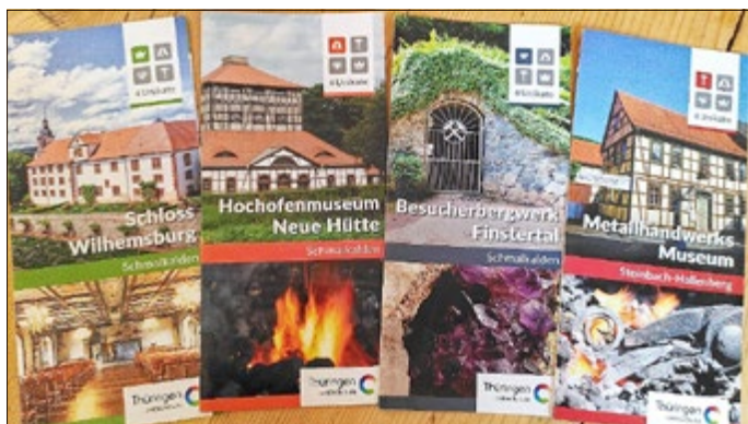
Neue Flyer für die „4 Unikate im Radius von 12 Kilometern“