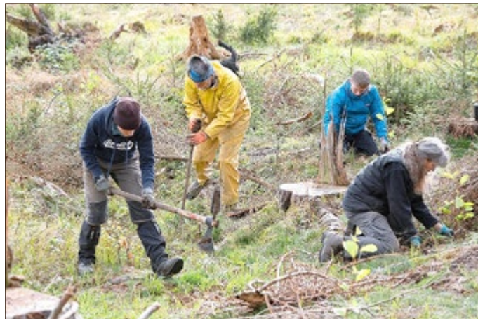
Waldumbau und -pflege sind einer der Schwerpunkte der Arbeit des Bergwaldprojekt e.V. Am 13.11.2021 möchte der Verein zusammen mit vielen freiwilligen Helfern 3000 standortheimische Laubbäume am Arzberg pflanzen.

Gepflanzt wird am Samstag, den 13. November 2021, im Zeitraum von 8.30 bis 16.00 Uhr, und unter Anleitung von Forstfachleuten vom Bergwaldprojekt. Um die Verpflegung der Freiwilligen kümmert sich ebenfalls das Bergwaldprojekt. Für die Teilnahme ist eine Anmeldung unter www.bergwaldprojekt.de erforderlich. Treffpunkt und weitere Informationen werden zusammen mit der Anmeldebestätigung per E-Mail mitgeteilt.