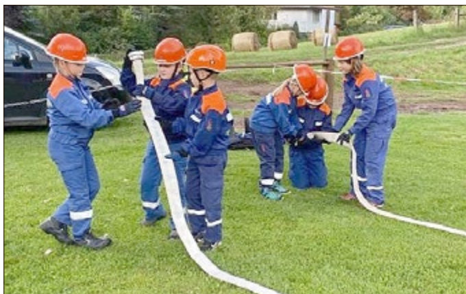
Gerätekunde, praktische Fertigkeiten und Geschicklichkeit wurden ebenfalls bewertet.