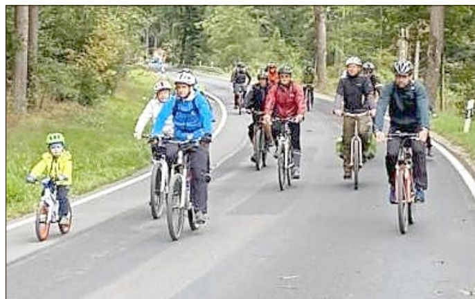
Die durch den Ersatzneubau der Hellfurthsbrücke gesperrte L1131 wurde von Groß und Klein als Radweg genutzt.