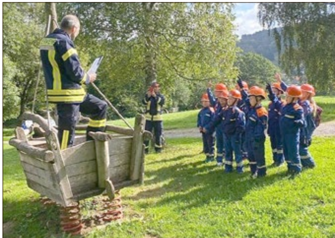
Theoretisches Wissen rund um die Feuerwehr wurde durch die Jugendwarte abgefragt.