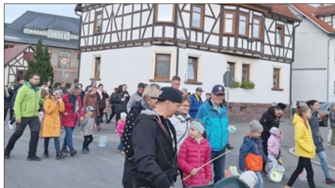
Großer Andrang beim Laternenumzug der Kita Haseltal