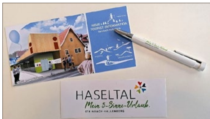
Ein kleiner Gruß aus der neuen Tourist-Information

Erhältlich sind die neuen Printprodukte in der Tourist-Information. Auch einen kleinen Gruß aus der Tourist-Information können Sie sich mitnehmen. Dieser besteht aus einer Postkarte, einem Kugelschreiber und einem Aufkleber, mit dem Sie z.B. an Ihrem Auto angebracht, auf Reisen für Ihre Heimat werben können.