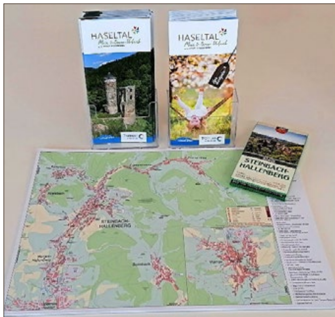
Unsere neuen Printprodukte

Ganz aktuell hat die Tourist-Information „Haseltal“ neue Printpro- dukte auf den Markt gebracht.