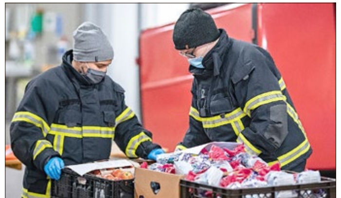
Mitglieder der Feuerwehr beim Sortieren der Überraschungen