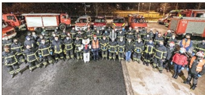
Aufstellung der Helfer und Ortsteilwehren der Stadt Steinbach-Hallenberg zum Beginn der Nikolaus-Aktion.