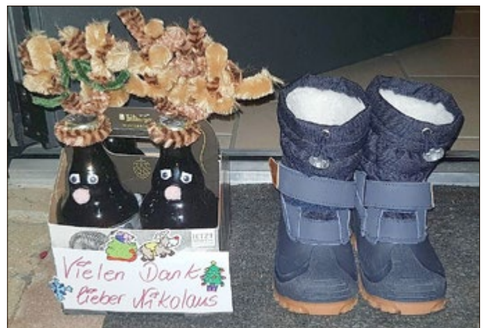
Auch die Helfer des Nikolaus erhielten zahlreiche Briefe und kleine Überraschungen.